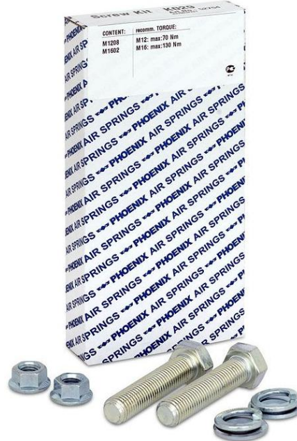
Abb.2: Schraubenkit für Traileranwendungen

ContiTech Luftfedersysteme liefert ab sofort zu den nahezu 200 wichtigsten Referenzen der Marken ContiTech und Phoenix die entsprechenden Befestigungssätze. Der Lieferumfang umfasst alle erforderlichen Befestigungsteile für Ihre Anwendung.