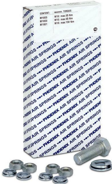
Abb.1: Schraubenkit für Bus & Truck Anwendungen